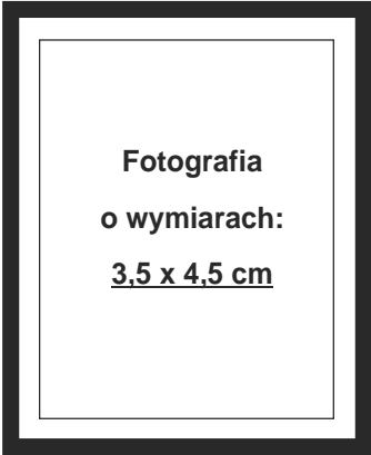
(nie wykracza poza ramki wewnętrzne)

Ja, niżej podpisany, uprzedzony o odpowiedzialność karnej za zeznanie nieprawdy lub zatajenie prawdy (art. 233 § 1 k.k.) oświadczam, że moje miejsce zamieszkania znajduje się na terytorium Rzeczypospolitej Polskiej, przy czym (zaznacz włączyć kwadraty liter „X”):